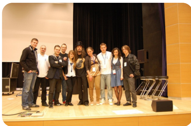
Koncert akustyczny zespołu „Hunter” był jednym z najważniejszych i cieszących się największym zainteresowaniem punktów programu „Dni Wydziału Zarządzania 2012”.

Po Dniach Wydziału Zarządzania czułam się częścią samorządu wydziałowego, ale absolutnie nie czułam się częścią całej organizacji, czyli Samorządu „uczelnianego” (samorząd studencki tworzą de facto wszyscy studenci danej uczelni, natomiast ja mam na myśli grupę studentów, którzy są członkami organów samorządu lub zwyczajnie się angażują mimo, że nie są oficjalnymi przedstawicielami). Członkowie Zarządu SSPRz wydawali mi się całkowicie obcymi