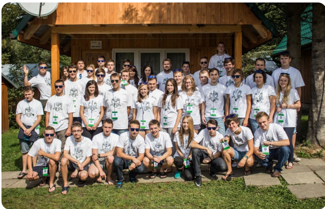
Pamiątkowe zdjęcie uczestników drugiej edycji Adapciaka Politechniki Rzeszowskiej, która odbyła się w Ośrodku Wypoczynkowym „Zacisze” w Wysowej-Zdroju (wrzesień 2014).

Byłam vice-koordynatorem pierwszej edycji, a rok później – koordynatorem edycji 2014. To, co wypracowaliśmy przez te pierwsze dwa lata Adapciaka było fundamentem tego, co jest kontynuowane przez samorządowców do dzisiaj. Każda z tych dwóch edycji obozów była wypełniona atrakcjami: szkoleniami, warsztatami, pokazami, zwiedzaniem Rzeszowa i uczelni, symulacjami sesji akademickiej, konkurencjami sportowymi, porannymi rozgrzewkami, nocnymi biegami, paintballem, zabawami tanecznymi, wieczornymi integracjami. Nie zabrakło także prawdziwego, studenckiego „chrztu” ;) Mnóstwo świetnych wspomnień.