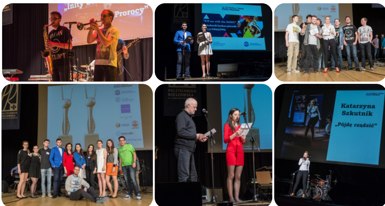
Zdjęcia z drugiej edycji Studenckiego Konkursu Piosenki „Kill me with the MUSIC”.