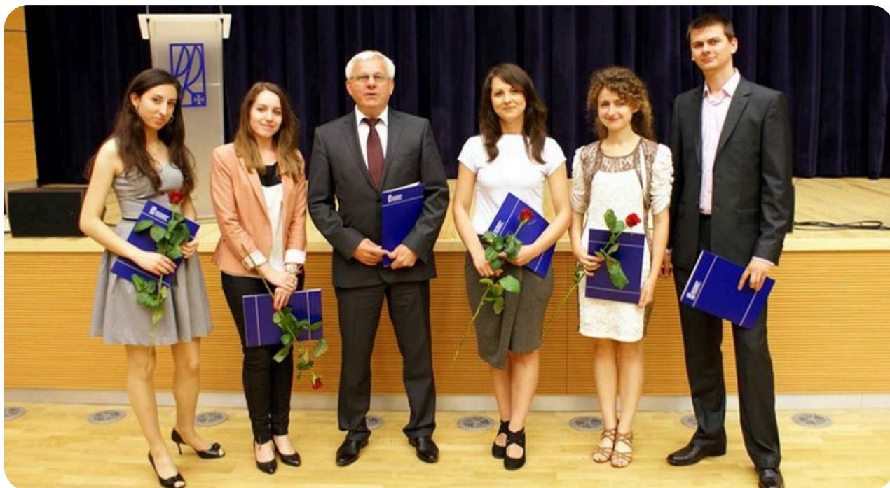
Zdjęcie pamiątkowe członków SKNKM z Prorokiem ds. Kształcenia po rozdaniu Nagród Rektora.

Dla wielu osób atrakcyjnym bonusem aktywności w samorządach studenckich są wyjazdy na konferencje samorządowe. W przypadku SSPRz były to głównie zjazdy Forum Uczelni Technicznych oraz ogólnopolskie konferencje organizowane przez Parlament Studentów Rzeczypospolitej Polskiej. Dla mnie te wyjazdy były okazją do odwiedzenia polskich miast, w których nigdy wcześniej nie byłam, do poznania i zaprzyjaźnienia się z ludźmi z innych uczelni, do wymiany doświadczeń oraz – nie ukrywam – do świetnej zabawy. Każdy taki wyjazd zostawiał po sobie naprawdę genialne wspomnienia.