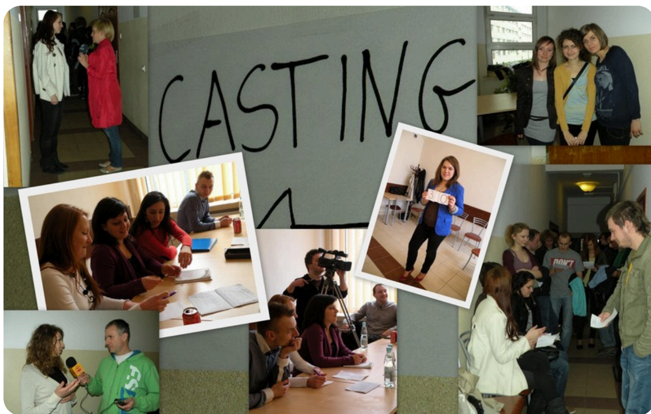
Casting do filmu promującego Politechnikę Rzeszowską i Miasto Rzeszów odbył się w świetlicy Domu Studenckiego "Tkar" Politechniki Rzeszowskiej.

i motywacją do działania. Po pierwszym dniu castingu byłam totalnie nakręcona pozytywnymi emocjami – naprawdę czułam, że uczestniczę w czymś wyjątkowym.