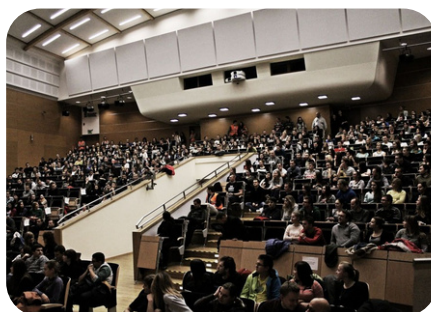
Zdjęcia z XIII i XIV edycji Nocnych Spotkań z Reklamą na Politechnice Rzeszowskiej.