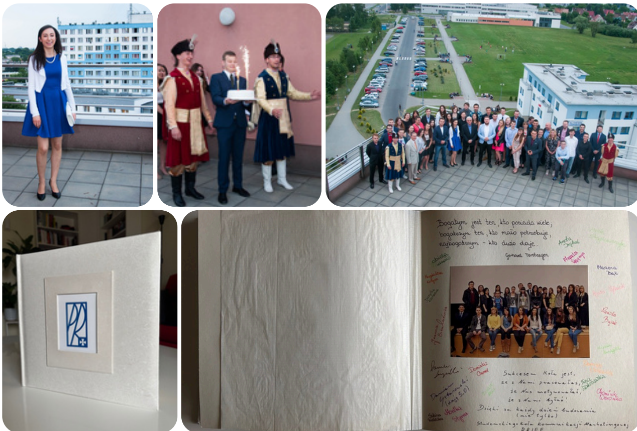
Fotografie z "oficjalnej" części niespodzianki pożegnalnej oraz pamiątkowy album i wpis członków Studenckiego Koła Naukowego Komunikacji Marketingowej "BRIEF".

To było przepiękne podziękowanie – lepszego naprawdę nie mogłabym sobie wymarzyć. Wtedy również otrzymałam wyjątkowy prezent: album z pamiątkowymi wpisami osób, z którymi pracowałam przez ostatnie lata, oraz juwenaliową koszulkę z podpisami wszystkich uczestników niespodzianki.