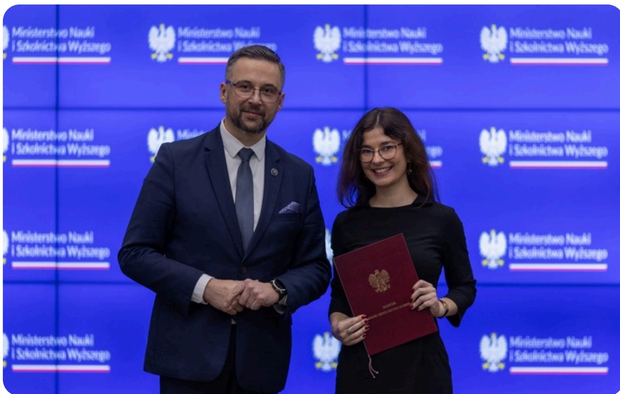
Wręczenie powołania na członka Rady NAWA przez Ministra Nauki i Szkolnictwa Wyższego Marcina Kulaska, 12.11.2025 r.

Dzięki programom międzynarodowym odbyłam staże w różnych krajach, poznając nowe metody pracy i ucząc się od najlepszych specjalistów. Te doświadczenia pokazały mi, że nauka nie zna granic – a każdy z nas może być częścią globalnej wspólnoty badaczy.