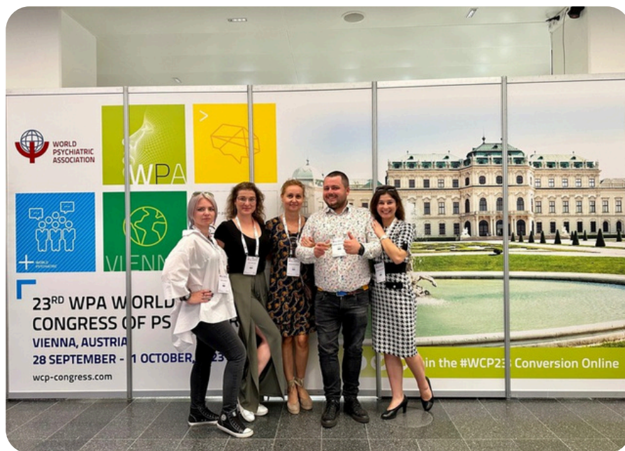
Po prawej: Kongres World Psychiatric Association w Wiedniu, 28 września 2023 r.

Moja droga – przez taniec, pasję, samorząd, naukę i współpracę międzynarodową – nauczyła mnie, że najważniejsi w życiu są zdrowi ludzie i zdrowe relacje. Takie relacje możemy tworzyć, kiedy żyjemy w świecie zgodnym z naszymi przekonaniami i oczekiwaniami. A tego świata nikt dla nas bez nas nie stworzy.