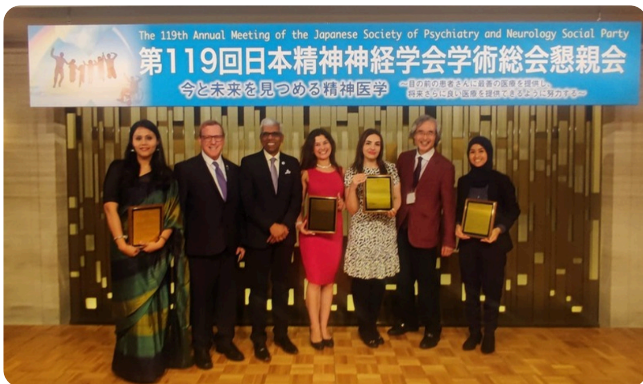
Wręczenie nagród podczas Kongresu Japońskiego Towarzystwa Psychiatrii i Neurologii w Yokohamie, 23.06.2023 r.

Jednym z ważnych kroków w mojej karierze było członkostwo w Japońskim Towarzystwie Psychiatrii i Neurologii. Rozpoczęło się, kiedy w 2023 roku otrzymałam nagrodę Japońskiego Towarzystwa Psychiatrii i Neurologii, która corocznie jest przyznawana 12 najwybitniejszym młodym psychiatrom na świecie. Był to dla mnie ogromny zaszczyt i dowód na to, że praca wykonywana z pasją może być dostrzeżona na całym świecie. Podczas kongresów Japońskiego Towarzystwa Psychiatrii i Neurologii w Yokohamie, Sapporo oraz Kobe miałam okazję przedyskutować swoje pomysły naukowe z najwybitniejszymi psychiatrami z całego świata. Współpracujemy przy tworzeniu kilku międzynarodowych projektów naukowych. Obecnie najważniejszym projektem jest dla mnie International Collaborative Research for Ijime (Bullying) Prevention and Intervention, który pod kierownictwem naukowców z Japonii zajmuje się zapobieganiem oraz wdrażaniem interwencji w sytuacjach występowania przemocy w szkołach w 6 krajach świata (Japonia, Indonezja, Libia, Nigeria, Polska i Tajwan). Obecnie przebywam na stażu naukowym na Uniwersytecie w Adelajdzie, gdzie mam możliwość współpracy z wybitnymi psychologami i lekarzami z południowej Australii.